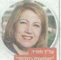
עוד' חסיד, "שמחות תכנות"