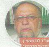
עוד' לונדוסיין, "מרש' תכניש"

אלא שבפועל, גם זה לא קרה. ממסך נוסף שביר' ז' ימים' עולה, כי הגילון ניסה בעצמו להגיע להסדר עם חברי הועדה, כדי שילצו אותו מהעניין. באמ' צעת פרקליטו הודיע להם, כי "דא שקל לפרוש מעבודתו באוניברסיטה כטוח הק' רוב - מטעמים שונים, וכי הוא מבקש להגיע להסדר שובי' לירי' ביטוי את עובדת פרי' שנו, טרם ההכרעה בהליך, ואת המשמעות הכספית של צעת זה, מבחינתו ומבחינת המוסר".