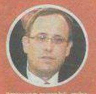
גיליה גילה, "לכיסוי הוצאות"

במסמך בחתימת מנכ"ל האוניברסיטה נכתב: "לפנים משורת הדין, וללא קבלת כל אחריות - תיארות האוניברסיטה להעמיד 75 אלף שקל... במקביל לחתימתה... היא תודיע למנכ"ל ולוועדה על ביטול תלונתה"